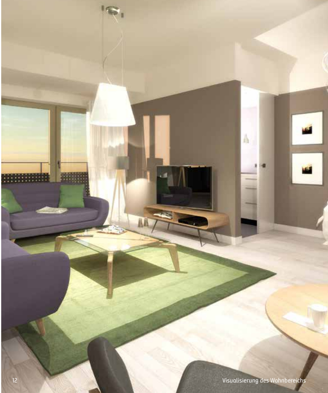
Visualisierung des Wohnbereichs